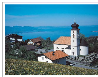
Bodensee-Vorarlberg Tourismus GmbH

Alle Angaben ohne Gewähr und auf eigene Gefahr. Es gelten die Nutzungsbestimmungen der bergfex GmbH.