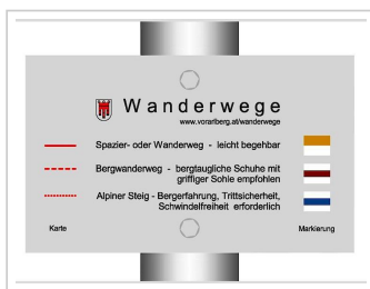
Bodensee-Vorarlberg Tourismus GmbH